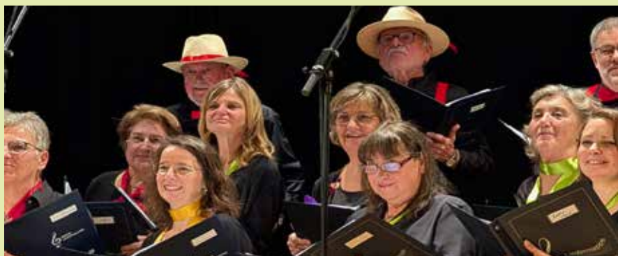
Unsere Liedertafel stellte heuer beim Konzert ihr großes musikalisches Können unter Beweis