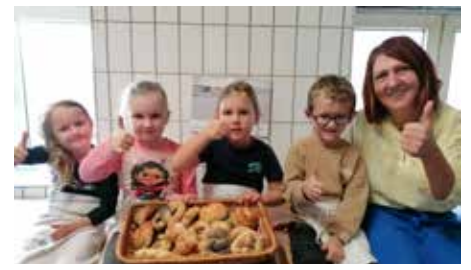
Das selbst gebackene Gebäck wurde mit Stolz präsentiert und genüsslich verzehrt – lecker!