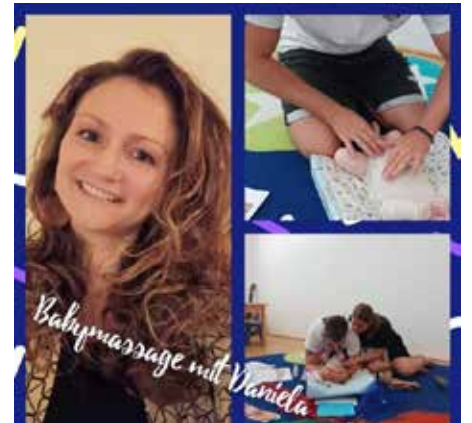
Lustige und berührende Momente im EKIZ