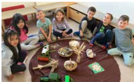
Vom Samen säen bis hin zur Ernte und zum Schluss der Genuss des selbst gebackenen Brotes

Geschichten, Lieder, eigenes Mehl mahlen, Backen - dies und mehr half uns, mit allen Sinnen den Prozess von der Saat bis zum leckeren Gebäck zu verstehen.