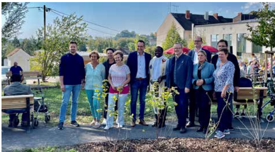
Gemeinsames Eröffnungsfoto aller Projektpartner des Generationenparks. Das Projekt wurde mittlerweile abgerechnet und Punkt genau umgesetzt. Die Gemeinde trägt rund ein Drittel der 192.000 Euro Gesamtkosten.

Winterdienst eingeschränkt. Wir möchten darauf hinweisen, dass der Besuch des Parks auf eigene Gefahr erfolgt. Bitte haben Sie Verständnis dafür, dass das Gelände nicht jederzeit eis- und schneefrei sein wird.