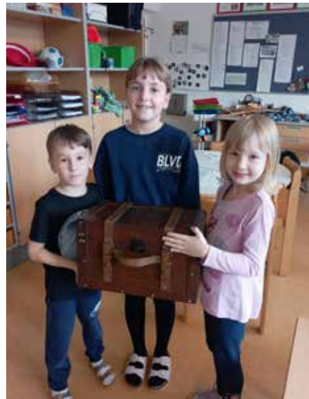
Der Schatz wurde im Zuge einer Rätselrallye gefunden.

Wir freuen uns schon auf viele spannende Nachmittage mit unseren Kindern im Hort!