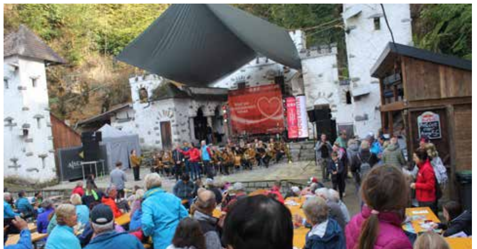
Mittagsrast mit der großen ORF Bühne auf der Aiser. Insgesamt waren 4 Feuerwehren, das Rote Kreuz und 11 Vereine mit über 300 Ehrenamtlichen im Einsatz.

Die „Rundwanderung Aisttal“ war eine wunderbare Gelegenheit, die Schönheit Schwertbergs und die Verbundenheit unserer Gemeinde zu erleben. Dank des großartigen Engagements aller Beteiligten und Unterstützer wurde die Veranstaltung ein voller Erfolg und zeigte Schwertberg von seiner besten Seite. Ein herzliches Dankeschön an alle, die dazu beigetragen haben, diesen Tag unvergesslich zu machen!