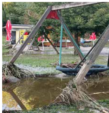
Die Sanierung der Freizeitwiese wird noch einige Zeit in Anspruch nehmen, wobei wir auf einen robusten Frost hoffen, um Schäden durch die Räumarbeiten zu minimieren.

Ein weiteres Thema ist die Möglichkeit, die Aist durch ein neues Renaturierungsprojekt im Bereich Josefstal und Aisting/Furth zu erweitern und den Hochwasserschutz weiter zu verbessern. Hierfür sind unzählige Gespräche mit den Grundeigentümern und zuständigen Behörden erforderlich.