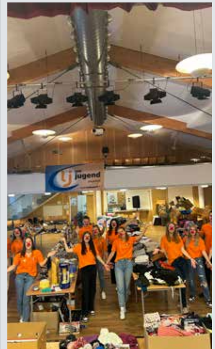
Mit Herz und Hand für den guten Zweck: Die Landjugend Schwertberg organisiert erstmalig einen Spendenflohmarkt für CliniClowns Austria.

Die Landjugend bedankt sich bei allen, die die Aktion mit einer Spende unterstützt haben.