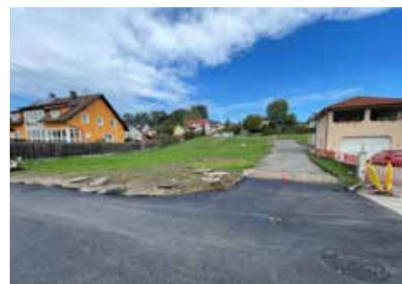
Aufschließung Billensteinerstraße ist abgeschlossen.

Der Gemeinderat hat mit den Eigentümer:innen die notwendigen Grundabtretungsvereinbarungen für die neue Siedlungsstraße besiegelt.