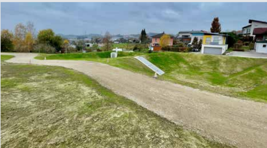
Die neuen Rückhaltebecken am ehemaligen ÖBB-Gelände und der einstigen Quelleinfassung für Dampflokotiven.

jetzige Projekt auf 375.000 Euro netto. Grundeigentümer erzwangen jedoch eine Abänderung des Projektes mit zusätzlichen Variantenuntersuchungen samt Wasserrechtsverfahren. So wurde der Hangwasserschutz letztlich in zwei Baulose geteilt und der zweite Abschnitt erst drei Jahre später mit einer Projekterweiterung umgesetzt. Die Material- und Lohnkosten sind seither gestiegen. Außerdem war der Bau des Beckens Süd beim Dachsberg ursprünglich nicht vorgesehen. Das zusätzliche Becken machte im Sommer enorme Geländearbeiten notwendig und wurde mit einem Abflusskanal besonders effektiv eingebunden. Die Linz Service GmbH passte nun ihren ursprünglichen Auftrag für Planung, Ausschreibung und örtliche Bauaufsicht an diese Projekterweiterung an und begründete die Mehrkosten, die durch eine Vertragsklausel rechtlich gedeckt sind. Eine Mehrheit des Gemeinderates segnete die Kostensteigerung von 45.000 auf 89.500 Euro ab.