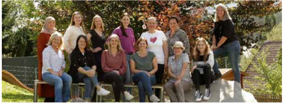
In guten Händen bei den Mitarbeiterinnen der Krabbelstube

Gleichzeitig konnten wir die sonnigen und warmen Tage im Freien nutzen und unser Augenmerk auf die Schönheit der Natur und unser Umfeld lenken. Die gesammelten Naturmaterialien werden anschließend zum Basteln und im spielerischen Alltag verwendet.