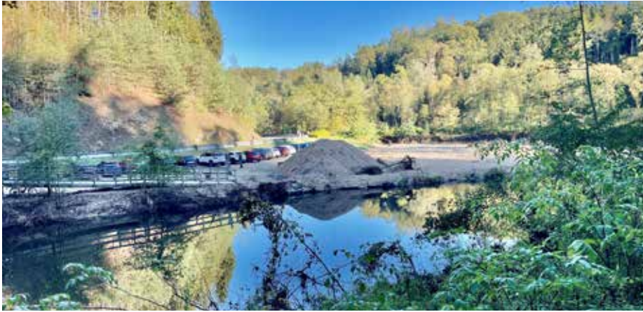
Der Sedimentfänger im Josefstal hat sich bewährt. Die Anlandungen können dort leicht beseitigt werden, im Flussbett ist das Ausbaggern viel teurer.