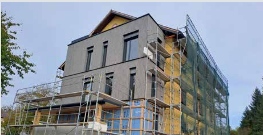
Die Bauarbeiten schreiten zügig voran. Mitte Mai 2025 soll der Umbau abgeschlossen sein.

der Estrich ist verlegt und im Frühjahr wird mit dem Innenausbau und der Gestaltung der Außenanlagen begonnen. Die Fertigstellung des Internates ist für Mai 2025 geplant. Für die Betreuung der Kinder ab dem Schuljahr 2025/26 wird bereits jetzt nach qualifiziertem Personal aus der Region gesucht. Bewerben können sich Sozialpädagog:innen, Alltagshelfer:innen und engagierte Hauswirtschafter:innen, die gesunde Mahlzeiten zubereiten. Nähere Infos auf der Homepage der Marktgemeinde Schwertberg. Scannen Sie einfach folgenden QR-Code: