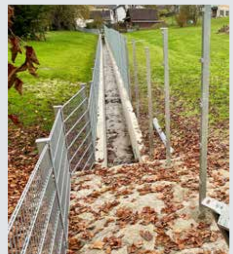
Das neue vergrößerte Betongerinne der Broat'n, welches zur Pergerstraße führt.