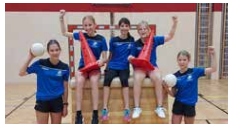
Die MS Schwertberg startet mit der neuen Morgensportstunde und setzt mit dem Projekt InnerVersum auf körperliche und mentale Gesundheit.

Sportlehrer*innen betreut. Begleitend zum Sportangebot hat sich die Schule zudem entschieden, ab dem neuen Kalenderjahr auf den Getränkeautomaten zu verzichten und eine „Wasserschule“ zu werden. Und auch die psychische Gesundheit wird seit dem Vorjahr mit dem Projekt „InnerVersum“ gefördert, in dem es um Achtsamkeit und das Kennenlernen der eigenen Gefühle geht. Hier arbeiten die ersten und zweiten Klassen jeweils 2 Stunden pro Monat im Rahmen der Unterrichtsstunde „Soziales Lernen“ mit externen Trainerinnen und Psychologinnen zusammen. Mit ihrer neuen Morgensportstunde nimmt die MS Schwertberg auch an