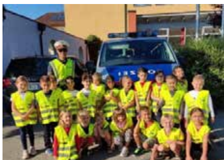
Warnwesten für alle Erstklassler

In den ersten Wochen wurden die Jüngsten von der Polizei und von Vertretern der Raiffeisenbank besucht.