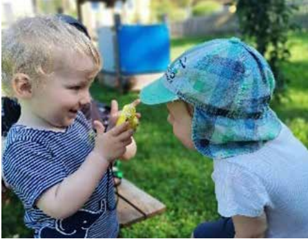
Den Blick für 's Wesentliche

Die Vorbereitungen für das Martinsfest sind schon voll im Gange. Die Laternen erstrahlen und voller Begeisterung singen die Kinder die Martinslieder. Die Vorfreude auf das Teilen der Martinskipferl, die von der Raiffeisenbank Schwertberg gespendet werden, ist riesig!