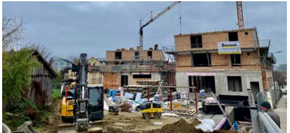
Die Wohnungsvergabe ist nun in vollem Gange. Nähere Infos bekommen Sie unter: www.schwertberg.at/news

gezeigt, dass einige der über 30 Interessenten, sich bislang noch nicht entscheiden konnten, verbindlich Zusagen zu treffen. Es werden daher mit Sicherheit auch noch einige Wohnungen am freien Wohnungsmarkt angeboten werden – ohne Betreuungsvertrag mit der Volkshilfe. Ziel der Gemeinde war, all jenen Menschen zu helfen, die aufgrund ihres Gesundheitszustandes auf eine betreibbare Wohnung angewiesen sind. Wer Bedarf hat, möge sich mit der Neuen Heimat oder der Bürgerservicestelle in Verbindung setzen.