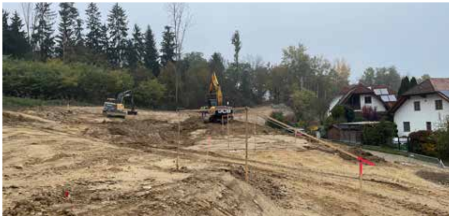
Die Holzgestelle zeigen die Dammhöhe des neuen Rückhaltebeckens an.

Zusätzlich wird am Ende der Ziegeleistraße eine Mulde geschaffen, die bei absoluten Katastrophenfällen das überschüssige Oberflächenwasser, das das Rückhaltebecken nicht mehr