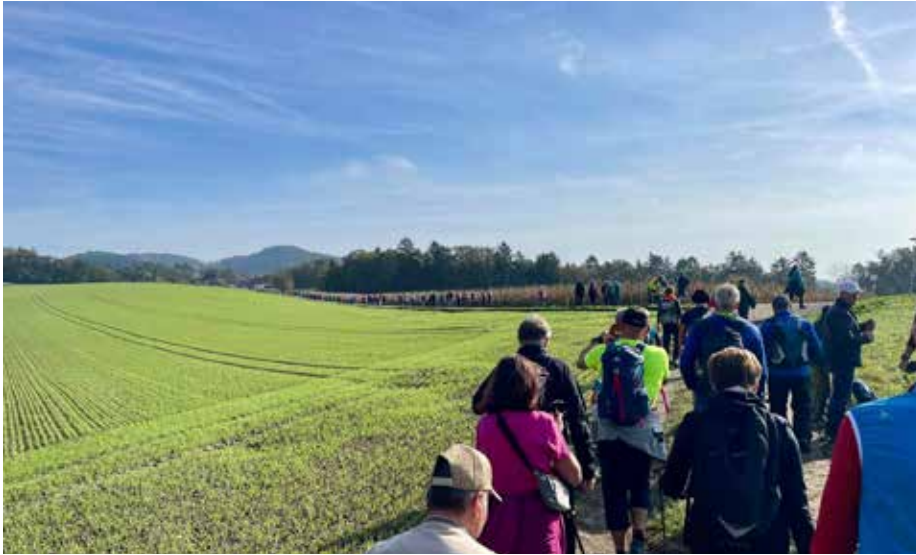
Über 5000 Wanderlustige genossen die gut organisierte Wanderung durch das Schwertberger Hügelland.

Am Sonntag, dem 20. Oktober, zog die Marktgemeinde Schwertberg bei goldenen Herbsttemperaturen zahlreiche Wanderbegeisterte an. Im Rahmen der ORF-Eventreihe „Lust auf 's Wandern“ folgten über 5.000 Naturfreunde unserem Motto „Mittelalterflair im Granitland“ und entdeckten auf einer abwechslungsreichen Strecke die schönsten Seiten unserer Gemeinde.