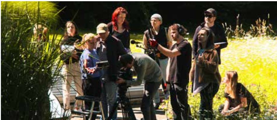
Hinter den Kulissen beim Filmdreh auf der Freizeitwiese an der Aist

Die Crew der Dokumentarfilmproduktion „Die Frauen von Friedegg“ war heuer für Dreharbeiten regelmäßig in Schwertberg und Umgebung zu Gast.