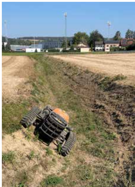
Im Sommer wurde fleißig getestet. Unsere Retentionsflächen werden immer mehr und müssen maschinell zu bearbeiten sein.

Bis nächstes Jahr sind 20 kleinere und größere Rückhaltebecken vom Bauhof-Team zu pflegen. Daher erleichtert die Raupe die Arbeiten erheblich.