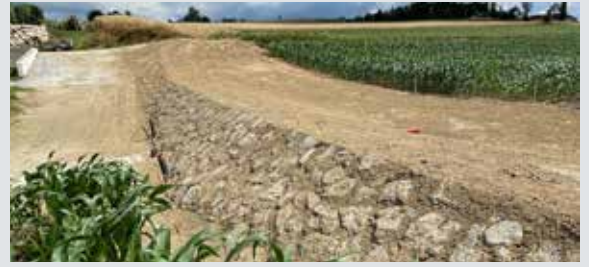
Nord-östlichstes Becken wurde größer dimensioniert

Das Projekt „Auf der Broat'n“ wurde größtenteils plangemäß abgeschlossen. Das bestehende Rückhaltebecken wurde um vier weitere Becken erweitert und das offene Gerinne zur Perger Straße vergrößert. Im Kreuzungsbereich Maria Langthaler-/Friedhof Straße wurde zudem ein Drosselbauwerk mit einem großen Verbindungskanal zum offenen Gerinne der Perger Straße errichtet. Beide Schutzprojekte (inklusive dem Projekt L. Wahl Straße) belaufen sich auf rund 2 Millionen Euro – eine sinnvolle Investition, um Schwertberg und seine Bevölkerung in beiden Ortsteilen noch besser vor Hoch- und Hangwässern zu schützen.