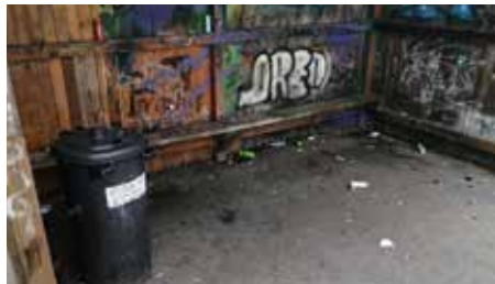
Müll gehört in die Tonne – Diese ist keine Deko sondern soll benutzt werden

In den vergangenen Wochen mussten wir leider feststellen, dass unser Skaterplatz zunehmend unter „Müllbergen“ leidet. Die Mülleimer auf dem