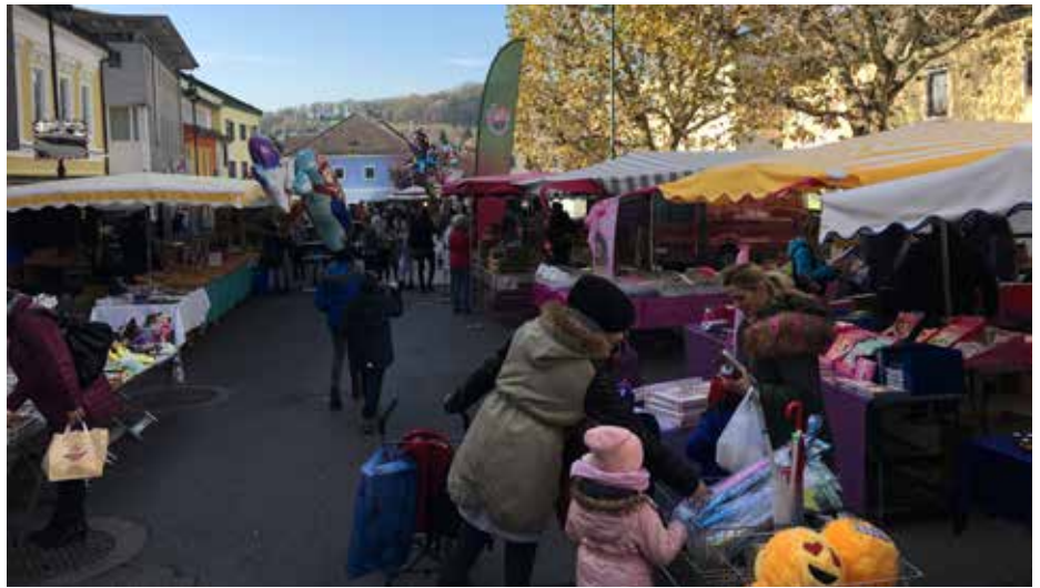
Achtung: 2025 findet der Schwertberger Kirtag am 3. November statt!

Wir freuen uns auf ein ebenso erfolgreiches Fest im nächsten Jahr und danken allen, die den diesjährigen Kirtag zu einem wunderbaren Ereignis gemacht haben!