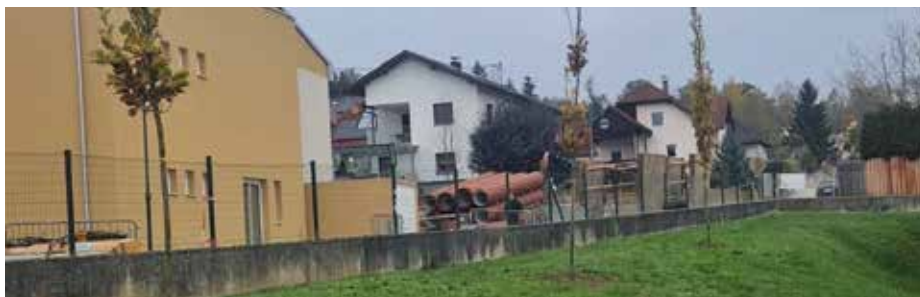
Im Zuge des Projektes wird auch der gesamte Schulkanal saniert. Der Baum vor der Schule musste dafür weichen und wurde durch eine Baumreihe am Billa-Grund ersetzt. Weitere Details dazu auf S. 10

meinde bleibt daher ein Betrag von € 477.000,00 zu finanzieren. Aus der Ausschreibung der Darlehensaufnahme ging die Raiffeisenbank Aist mit einem Zinsaufschlag von 0,42 % auf dem 6-Monats-EURIBOR und einer Laufzeit bis 30.6.2040 als Bestbieter hervor. Mit der Darlehenstilgung wird ab 1.7.2025 begonnen.