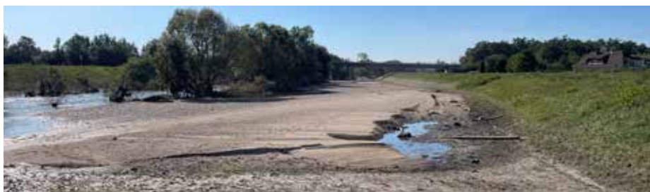
Die geplante Renaturierung der Aist soll aufgrund des Hochwassers erweitert werden.

mit der Hangwasserschutz weiter verbessert – was sehr sinnvoll ist, wie die hohen Pegelstände der Aist im September zeigten. Die Gesamtkosten werden sich auf ca. 500.000,- Euro belaufen. Wir wollen auch mögliche Synergien mit der Räumung der Aist nutzen. Der Gemeinderat beauftragte die Firma Wasser & Umwelt mit den Planungsarbeiten in Höhe von rund EUR 25.000 brutto.