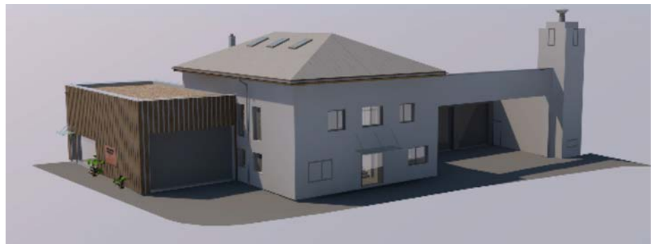
So soll das neue FF Haus in naher Zukunft aussehen

Ein weiteres positives Zeichen setzte der Gemeinderat mit einem einstimmigen Beschluss: Das Sitzungsgeld dieser Sondersitzung wird vollstän-