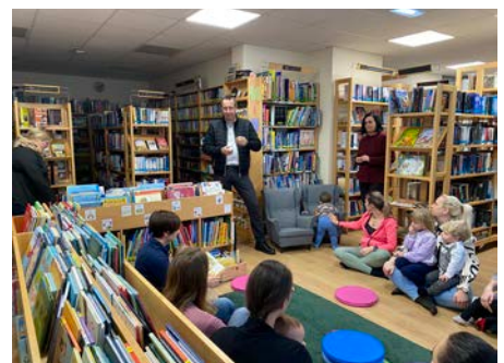
MuKi-Treff in der Bibliothek Schwertberg