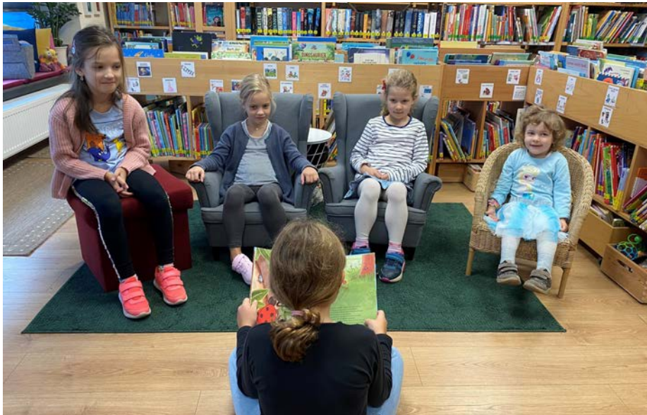
Der Vorlesetag wird von den Kindern immer gerne in Anspruch genommen.

Das genaue Programm findest du unter www.schwertberg.bvoe.at