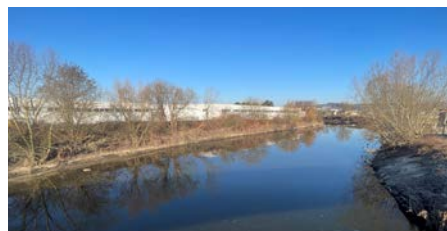
Bis Mitte März wurde die Aist vom Dachsberg bis zur Aistingger Straße geräumt