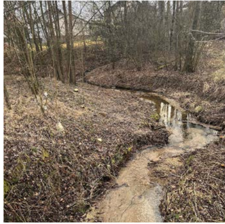
Der Poneggenbach wurde heuer im Februar geräumt. Eine wichtige Maßnahme im Bezug auf den Hochwasserschutz.

diese fällt in die Zuständigkeit des Gewässerbezirkes und muss daher gesondert erfolgen.