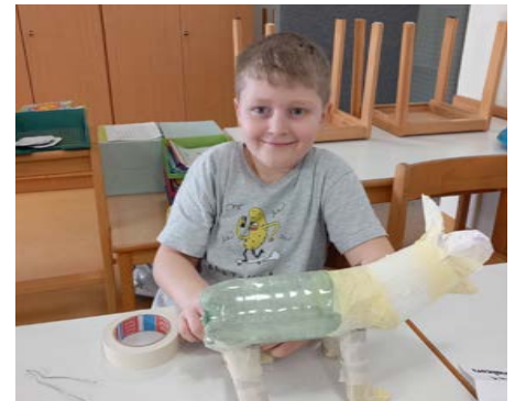
Tolle Gipsfiguren konnten präsentiert werden