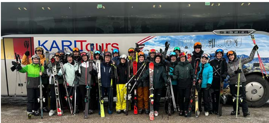
Die Mitglieder der Landjugend strahlen beim Skiausflug nach Gosau mit der Sonne um die Wette

Diese Erfahrungen werden uns dabei helfen, unsere Aufgaben noch besser zu gestalten und die Landjugend weiter voranzubringen.