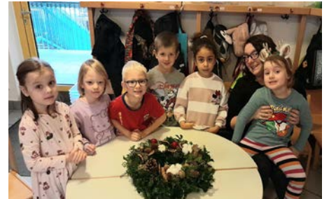
Eltern besuchen die Kinder im Kindergarten

empfangen, wobei jede Gruppe andere Schwerpunkte setzt wie zum Beispiel Vorlese-/Koch-/Spiele- oder Experten-vormittag.