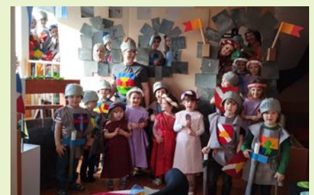
Die Ritter der Burg Drachenstein

Fest auf Burg Drachenstein: Wir reisen in die Zeit zurück, sind schön gekleidet, welch ein Glück. Beim Reitkampf jubelt und macht Platz, dem Gewinner gebührt der große Schatz.