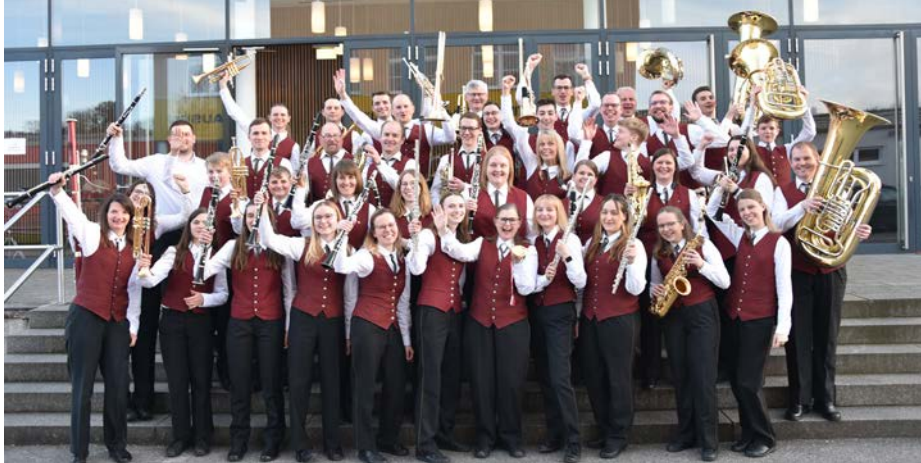
Spaß bei den Vereinsproben wird bei den Mitgliedern des Musikvereins groß geschrieben

Uhr im Donausaal Mauthausen. Die genaue Uhrzeit des Musikvereins Schwertberg wird noch bekannt gegeben. Die MusikerInnen freuen sich auf zahlreiche Gäste aus dem Heimatort, die den Klängen lauschen und mitfiebern. Kurz danach geht es weiter mit einem Benefizkonzert: Am 5. April 2025 um 19.30 Uhr musizieren sowohl der Musikverein als auch die Bläserkids in der Pfarrkirche Schwertberg. Die Gäste erwarten ein abwechslungsreiches musikalisches Programm. Bei schönem Wetter klingt der Abend im Freien bei einer kulinarischen Verköstigung aus.