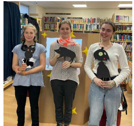
Lange Nacht der Bibliotheken

Um 18.30 Uhr werden die Aiserkids ein Schattentheater präsentieren. Hauptstar des Abends wird das Tier des Jahres 2025 sein, nämlich der Rotfuchs.