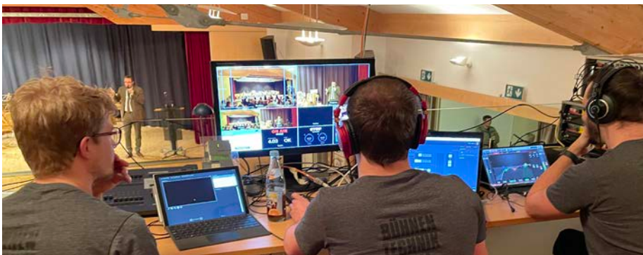
Personelle Engpässe beim BT-Team machen eine Übertragung zukünftig nicht mehr möglich

Leider können die Sitzungen des Gemeinderates der Marktgemeinde Schwertberg nicht mehr vom Technikteam der Aiserbühne online übertragen werden.