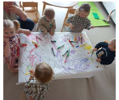
Die Kinder der Krabbelstube malten zur Musik und erstellten tolle Kunstwerke

Beim Schöpfen, Befüllen, Umfüllen konnten die Kinder das angebotene Material (Lavendel) nicht nur spüren und sehen, sondern sich auch im Spiel in der Hand-Auge-Koordination üben.