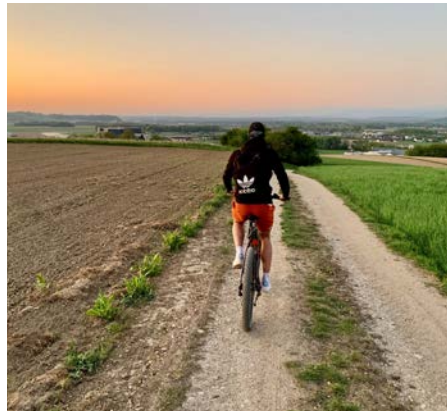
Mountainbiken auf dafür vorgesehenen Wegen soll das Miteinander verbessern

Der Gemeinderat hat Gestattungsverträge für eine 28 km lange Mountainbike-Strecke im Gemeindegebiet beschlossen. Im Laufe des Jahres wird diese als Teil eines LEADER-Projekts im Bezirk Perg beschildert. Oberstes Ziel ist dabei, mehr Klarheit und Fairplay Regeln für Mountainbiker zu schaffen.