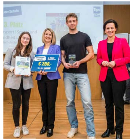
Sensationeller 3. Platz für die MS Schwertberg

Kinder werden hier abwechselnd von verschiedenen Sportlehrerinnen und Sportlehrern betreut. Das gemeinsame Spielen steht hier im Vordergrund, abgerundet wird das Angebot durch Ausdauer-, Koordinations- und Kräftigungsübungen. Begleitend zum Sportangebot hat sich die Schule zudem entschieden, ab dem neuen Kalenderjahr auf den Getränkeautomaten zu verzichten und eine „Wasserschule“ zu werden. Und auch die psychische Gesundheit wird seit dem Vorjahr mit dem Projekt „InnerVersum“ gefördert, in dem es um Achtsamkeit und das Kennenlernen der eigenen Gefühle geht.