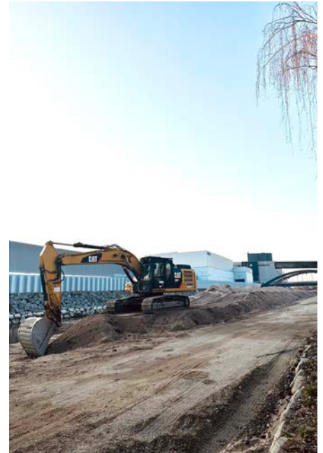
Die Arbeiten entlang der Firma Engel sind in vollem Gange. Unmengen an Sand wurden ausgebaggert.