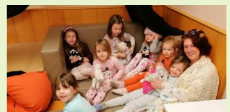
Schlafmützenfest im Pfarrcaritas Kindergarten