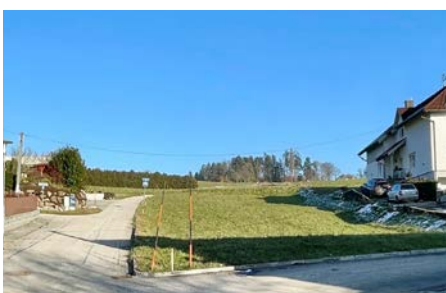
Hier soll eine nachhaltige Entwässerungslösung entstehen

Der Gemeinderat hat den Teilankauf eines Grundstücks zur Verbesserung der Oberflächenentwässerung im Bereich Panoramastraße, Sonnenweg und Kalvarienbergstraße beschlossen. Die Gemeinde erwirbt 558 m 2 aus dem Grundstück 550 (neu 550/2), KG Schwertberg zum Pauschalpreis von 10.000 Euro. Zusätzlich wird eine 45 m 2 große Fläche entlang der nördlichen Straßengrundgrenze kostenfrei übergeben.