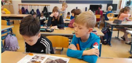
Volksschüler lesen den Kindergartenkindern vor

Die Schulanfänger des Kindergartens haben mehrmals die Möglichkeit, die Volksschulkinder in der Schule zu besuchen. Dort nimmt man sich die Zeit, den Kindergartenkindern Bücher vorzulesen. Die Volksschulkinder können ihre Lesefähigkeiten unter Beweis stellen, und die Kinder