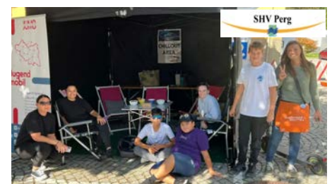
Chillout Area am Marktplatz Schwertberg

rum ermöglichte. Das Jahr klang mit der Weihnachtsfeier und einer Vielzahl an laufenden Angeboten wie gemeinsames Kochen, Unterstützung bei der beruflichen Orientierung und Lernhilfen aus.