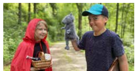
Verschiedene spannende Angebote rund um Märchen erwarten die Kinder.

Der märchenhafte Sommer findet seinen literarischen Höhepunkt am Freitag, 24. Oktober, wenn die Bibliothek zum großen Märchenvorlesetag lädt. Und auch im Herbst geht das Projekt weiter: Gemeinsam mit den Aiserkids organisiert die Bibliothek eine Märchenwanderung durch Schwertberg. Natur, Geschichten und Gemeinschaft verschmelzen zu einem besonderen Erlebnis. Ergänzend dazu bietet die Bibliothek laufend neue Medien rund ums Märchen an.