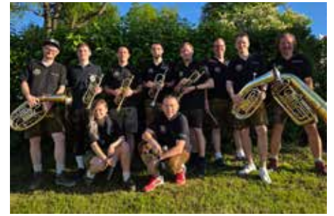
Mit der Brassband „d'Aushüfn“ ist Stimmung garantiert (Bild oben), Kinder kommen beim Kistenklettern und der Hüpfburg auf ihre Kosten (Bild unten).