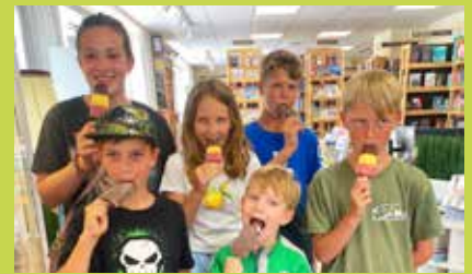
Die Kinder genossen das Eis sichtlich!

Nachdem das alljährliche Ferien-StartFest der Marktgemeinde am Freitag, 4. Juli im Park aufgrund eines Wolkenbruchs nicht stattfinden konnte, wurde kurzerhand Ersatz organisiert: