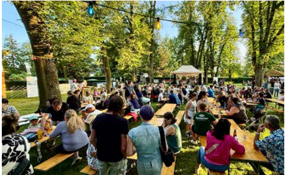
Zahlreiche Gäste genossen den Auftritt von „Queen‘z Garden“ im Juni (Bild links oben) und der Schülerband (Bild links unten).