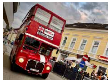
Die lange Einkaufsnacht sorgte für reges Treiben in den Geschäften und Gastgärten, besonders beliebt war auch der original London Bus.

Die Einkaufsnacht hat einmal mehr gezeigt, wie lebendig und attraktiv Schwertberg ist – ein rundum gelungener Abend für Jung und Alt.