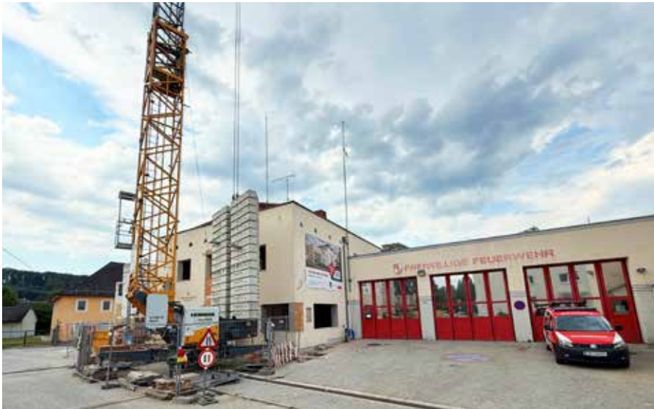
Die Umbauarbeiten schreiten zügig voran: Am 23. Juli findet bereits die gleichenfeier statt! (Bild oben) Die Feuerwehrmänner packen selbst tatkräftig mit an, egal ob vor Ort auf der Baustelle oder bei der gemeinsamen Baubesprechung (Bilder unten).