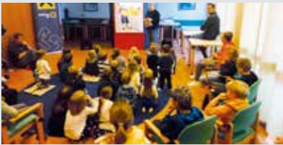
Veranstaltung Kasperltheater: Beim Kasperl im Frühjahr durften wir wieder herzlich lachen

Info und Anmeldung: ekiz.sonnenschein@kinderfreunde-ooe.at