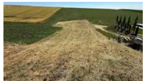
Gerüstet für zukünftige Starkregenereignisse: Ackerflächen werden in Grünland umgewidmet (Bild oben).

Die dringend notwendige Zufahrt-Sanierung zu zwei Gemeindemehrparteienhäusern in der Schacherbergstraße wurde an die Firma BT Bau GmbH vergeben, inklusive Tausch der Wasserleitung und Erneuerung des Straßenbelags. Die Gesamtkosten betragen rund € 59.400 brutto, die Bauarbeiten sind für Herbst 2025 geplant.