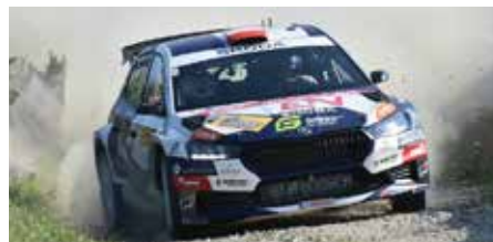
Mühlstein Rallye ist für 2026 geplant.

Zweitens befand sich der veranstaltende Rallye Club Perg in einer personellen Umstrukturierung und hat sich mittlerweile mit dem Rallye Club Mühlviertel zusammengeschlossen. Damit war die Zeit einfach zu kurz, für alle geplanten Sonderprüfungen die notwendigen Behördengenehmigungen rechtzeitig zu erhalten.