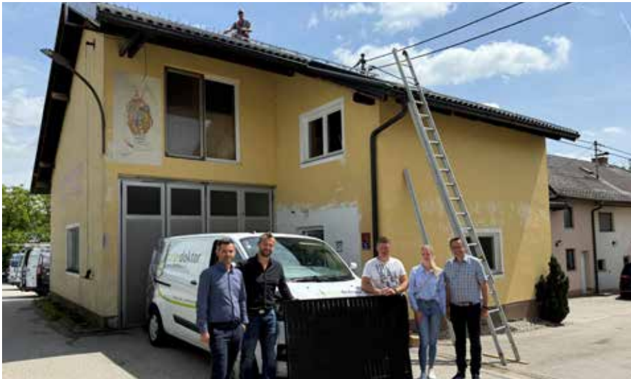
Die PV-Montage auf dem Vereinshaus Winden-Windegg. Ein herzliches Dankeschön gilt der Firma Solardoktor, die alle Montagen zügig, fachmännisch und zuverlässig umgesetzt hat.