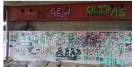
Kein schöner Anblick: Vandalismus in Schwertberg

Gegen Vandalismus und Sachbeschädigung im Gemeindegebiet wird rechtlich strikt vorgegangen, auch wenn die Sprayer minderjährig sind. Bei derartigen Fällen werden nämlich die Eltern zur Haftung gezogen.