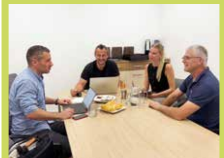
Für die Anliegen und Fragen der Interessenten zum Thema Erneuerbare Energie wurde sich ausgiebig Zeit genommen.

Am 5. Juni fand der erste KEM-Bürgerinfo-Sprechtag am Gemeindeamt statt – und wurde sehr gut angenommen. Fortsetzung ist auf alle Fälle garantiert!