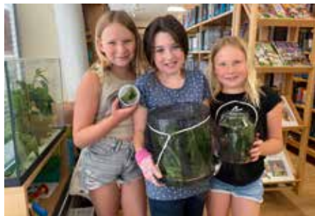
Im „Raupenheim“ konnten die Kinder die Verwandlung zum Schmetterling miterleben.