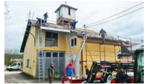
Fleißige Helfer beim Umbau des Vereinshaus (oben) und fertige Paneele bei FF Winden-Windegg (unten).