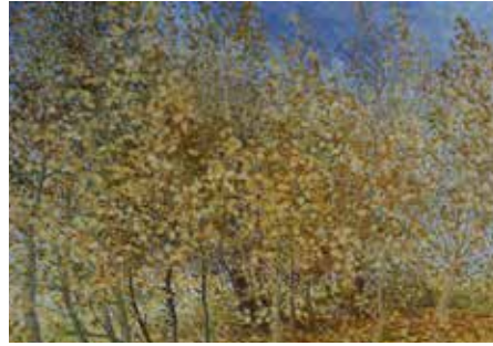
Wunderschöne Gemälde und Bilder von Maria Eichinger erwarten die Besucher:innen