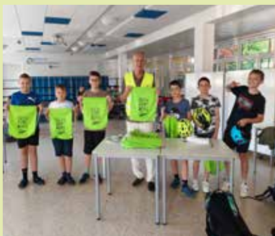
Ein kleines Dankeschön für die Teilnehmer:innen der „AKTIONfahRRAD“