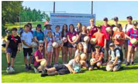
Sowohl beim Soccergolf der Bläserkids (Bild links) als auch bei der Marschwertung in Ried in der Riedmark (Bild rechts) macht der Musikverein eine gute Figur.