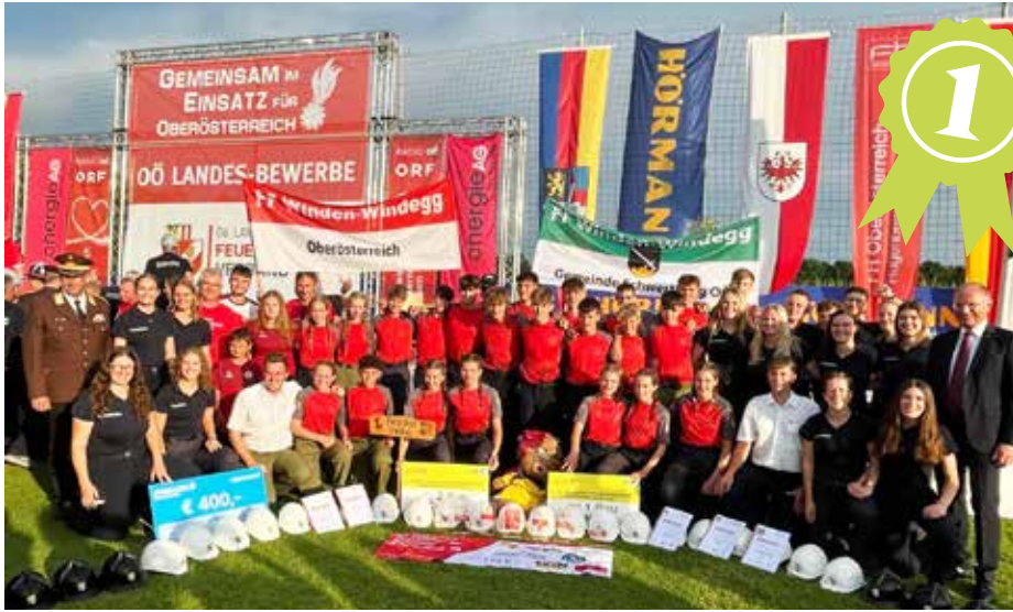
Ein toller Erfolg: Die Jugendgruppen der FF Winden-Windegg belegten den 1. und 2. Platz!

Hervorragende Leistungen aller Teilnehmer:innen und ein Landessieg der Jugendgruppe