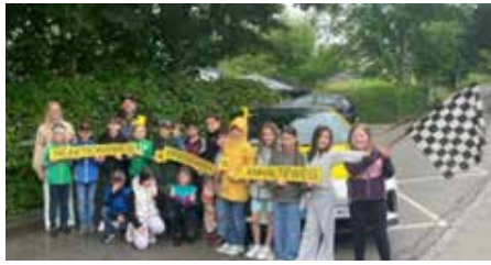
Ob im Straßenverkehr oder beim Besuch der Kindergartenkinder, die Schulkinder waren mit vollem Einsatz dabei.

Im Zuge des Jahresthemas in unserer Gruppe 2 „Im Weltall ist viel los“ befassten wir uns das ganze Jahr über mit den Planeten unseres Sonnensystems, erfuhren Wissenswertes über Saturn, Uranus, Merkur und Co und lernten viele interessante Details über unseren Mond kennen. Ende Mai beschäftigten wir uns mit den Sternbildern und den zwölf Sternzeichen.