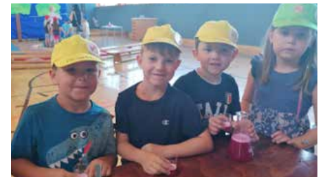
Egal ob bei der Jause (oben) oder beim Theaterstück (unten), die Kinder genossen sichtlich den Ausflug.

Es war ein lustiger, lehrreicher und spannender Vormittag, den die Kinder durch ihre aktive Teilnahme gestalten und erleben durften. Umso mehr freuen sie sich jetzt auf ihren eigenen baldigen Schulstart!