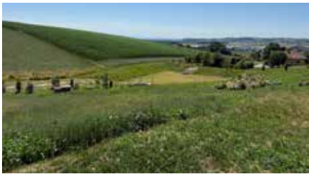
Die Rückhaltebecken fügen sich naturnahe ins Landschaftsbild ein

Die Wirtschaftsgemeinschaft WIG Schwertberg erhält eine Förderung in Höhe von € 4.000. Diese dient der Organisation von Veranstaltungen wie der Langen Einkaufsnacht und der Fachsings-Funparade, sowie für Werbemaßnahmen und die Vereinszeitung.