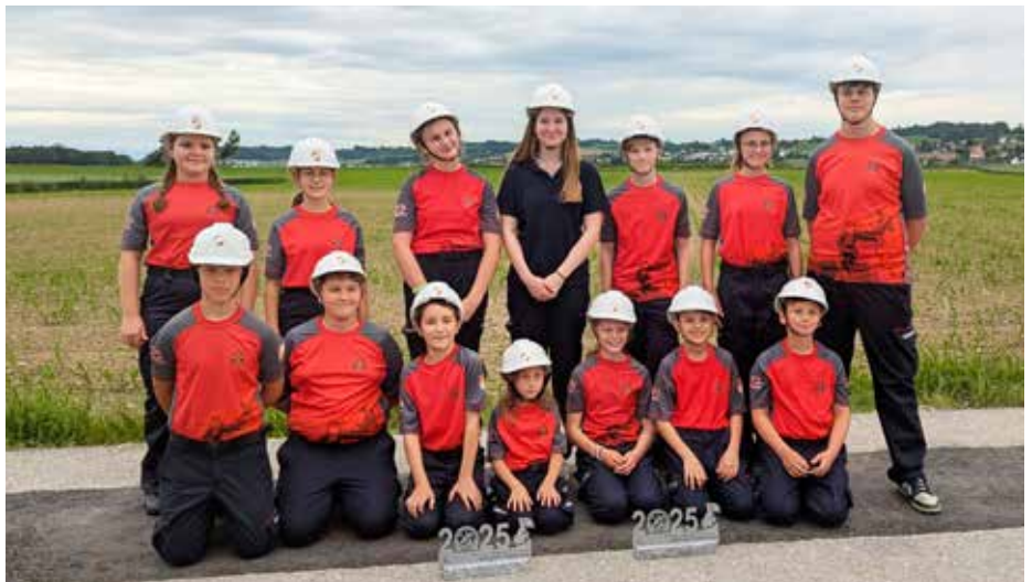
Beim Leistungswettbewerb am Samstag machte die Jugendgruppe Poneggen/Aisting-Furth ihren Kameraden alle Ehre (Bild oben rechts). Kabarettist Walter Kammerhofer sorgte am Freitag für einen gelungenen Start des Jubiläumsfestes (Bild unten links).