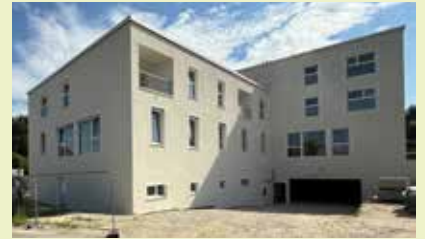
Mitte November ziehen bereits die ersten Mieter:innen ins Gesundheitszentrum ein.

Das Gesundheitszentrum ist außen fertig. Im Juli wird noch die Außengestaltung der Vorplätze bzw. Anpassung der Gehsteige samt Verkehrsinsel bei der Kreuzung Heimstätteweg - Kalvarienbergstraße - Hafnerstraße vollzogen. Das Primärversorgungszentrum wird März/April 2026 eröffnen.