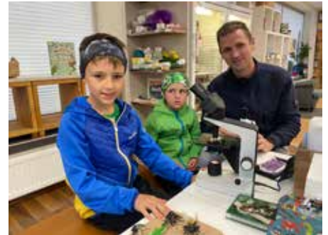
Die Mitmachstation zum Thema Insekten bot neben einem Mikroskop auch anschauliche Infotafeln.

Für kleine Naturforscher gab es wieder viel Spannendes zu entdecken: Die Welt der Insekten lud mit einer Mitmachstation zum Erforschen ein und in einem Terrarium wurden aus Raupen wunderschöne Schmetterlinge. Mit diesen Aktionen setzt die Bibliothek Schwertberg ein starkes Zeichen: Lesen, Forschen und Staunen gehören zusammen und Naturwissenschaften können spannend, kreativ und lebendig sein.