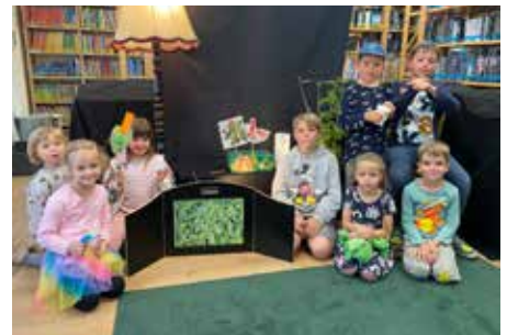
Vorleseaktionen zum Schmetterling mit dem KIGA Bunte Welt und im LESEHAUS.