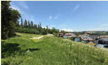
Begrüntes Rückhaltebecken Ludwig-Wahl-Straße

Die umfangreichen Baumaßnahmen sind endlich abgeschlossen – nun liegt auch die endgültige Abrechnung des Bauprojekts vor. Die Gesamtkosten belaufen sich auf € 1.262.778,93. Die Hauptleistungen wurden von der Firma BT-Bau GmbH erbracht, deren Schlussrechnung sich auf € 1.075.448,38 beläuft. Darin enthalten sind auch zusätzliche Abdichtungsarbeiten in Höhe von rund € 62.975. Ursprünglich war man von höheren Baukosten ausgegangen. Der Einsparung von rund € 20.000 stehen auch zusätzliche Ingenieurleistungen, geotechnische Untersuchungen und eine höhere Grundablöse von € 93.280,41 für insgesamt 5.589 m 2 (statt geplanten 4.500 m 2 ) Fläche gegenüber.