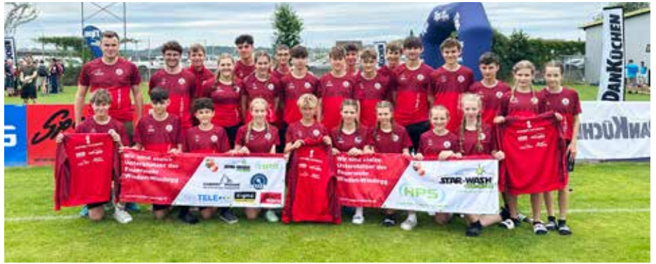
Die neue Bekleidung der Feuerwehrjugend ist ein echter Hingucker.

Beim Bezirks-Sensenmähen und der Agrar- und Genusssolympiade zeigten unsere Mitglieder ihr Können – sowohl im sicheren Umgang mit der Sense als auch mit Wissen rund um Landwirtschaft, Ernährung und Regionalität.