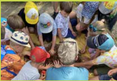
Spannendes rund um den Biber entdecken.