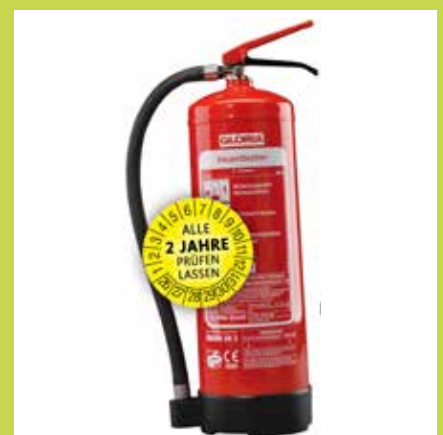
Alle 2 Jahre sollen Feuerlöcher überprüft werden.

Sa, 02.08.2025, 08:00 – 12:00 Uhr Ort: Feuerwehrhaus FF Winden-Windegg Windegg 100, 4311 Schwertberg www.ff-winden-windegg.at