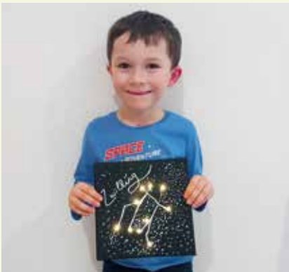
Jedes Kind hatte die Möglichkeit, eine Leinwand mit seinem Sternbild zu gestalten.