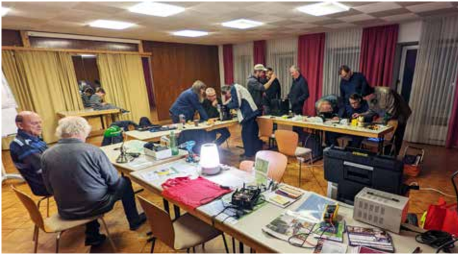
Beim Repair Café wurden ganz nebenbei Organisationstalent, Kommunikationsfähigkeiten und technische Kenntnisse gestärkt. Eine solche Zusammenarbeit ist in vielerlei Hinsicht bereichernd – fachlich wie menschlich.