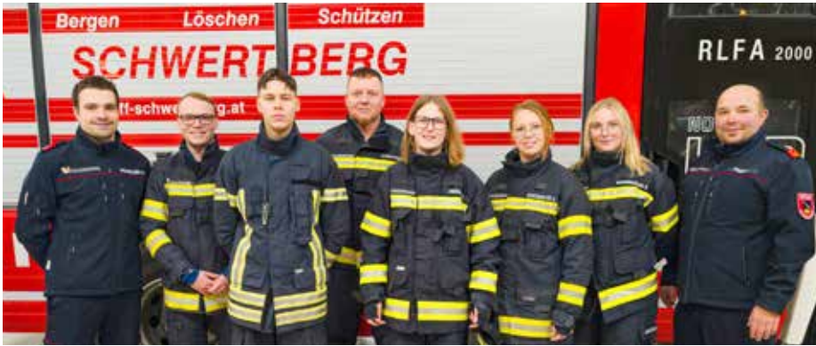
Herzliche Gratulation an die erfolgreichen Absolvent:innen zur bestandenen Ausbildung!