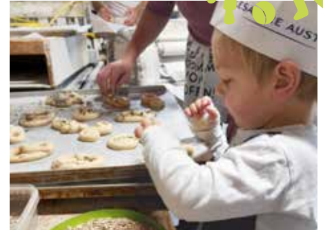
Beim Back-Vormittag in der Bäckerei Strauß wurden gemeinsam köstliche Weckerl gezaubert und anschließend an alle Krabbelgruppen gerecht aufgeteilt.

In den letzten Monaten hörten die Kinder nicht nur vom Teilen, sondern sie erlebten es selbst. Sankt Martin teilte, wie auch der hl. Nikolaus. Und gerade in einer Gemeinschaft braucht es die Rücksichtnahme und das Verständnis für andere.