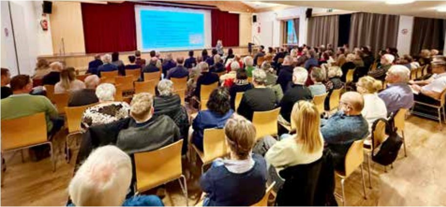
Die anwesenden Schwertberger:innen beteiligten sich aktiv bei den Präsentationen und Diskussionsrunden und stimmten per App über die 14 Projektideen ab.