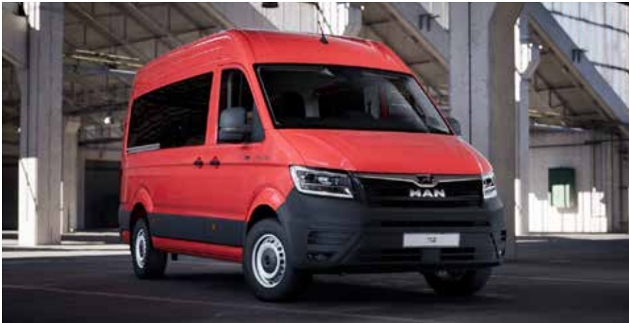
Das neue Mannschaftstransportfahrzeug (MTF).