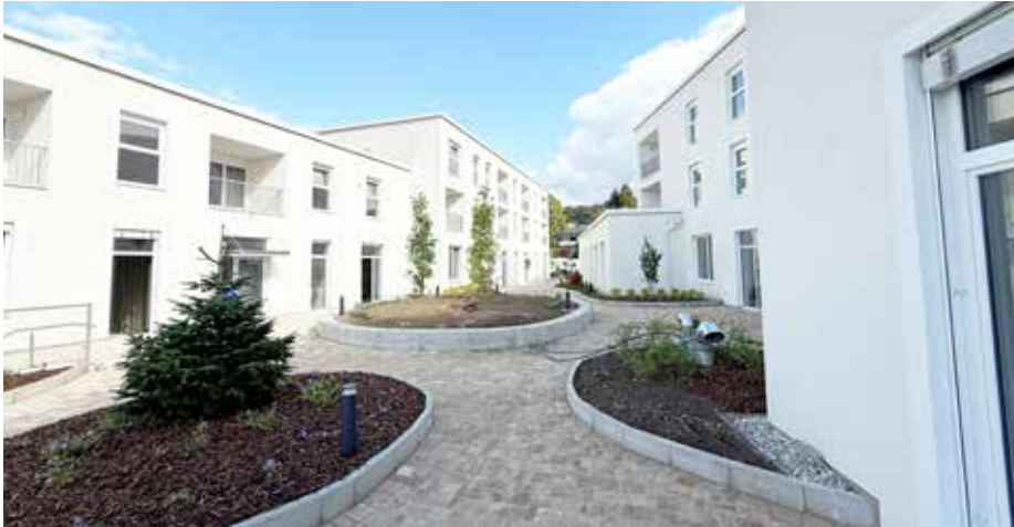
Das Gesundheitszentrum in Schwertberg wird in den nächsten Monaten von den neuen Ärzt:innen bezogen.