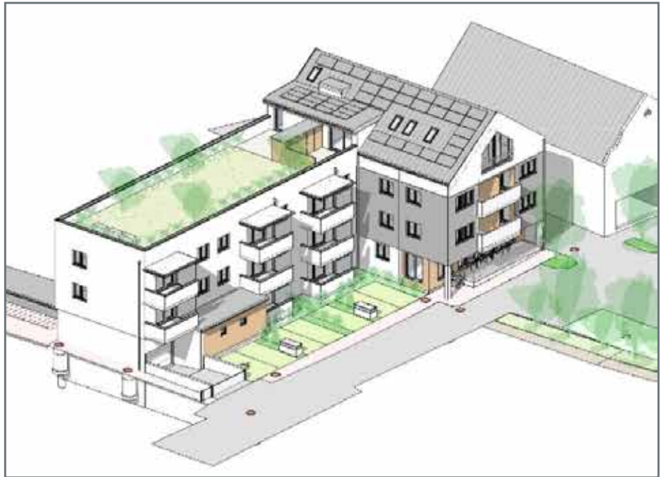
Der geplante Neubau des ehem. Panhauser-Hauses im Markt wird sich auch optisch gut ins Ortsbild einpassen.

Die wichtigsten Infos und Beschlüsse aus dem Gemeinderat vom 11. Dezember 2025