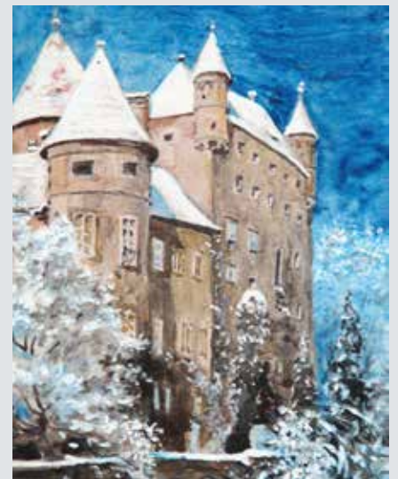
Postkarte „Schloss Schwertberg“