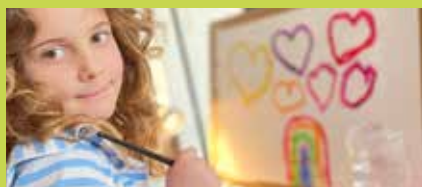
Die Kunststationen in der Bibliothek laden zum Experimentieren ein, es gilt: Hauptsache bunt!

Farbe bringt derzeit ein neues Projekt in der Bibliothek, das Kunst, Kreativität und Lesefreude miteinander verbindet und auf den bunten Fasching einstimmt: An mehreren kleinen Kunststationen können Kinder mit Farben und Formen experimentieren. Im Mittelpunkt steht dabei nicht das Ergebnis, sondern der kreative Ausdruck. Die entstandenen Werke werden in den Schaufenstern der Bibliothek präsentiert.