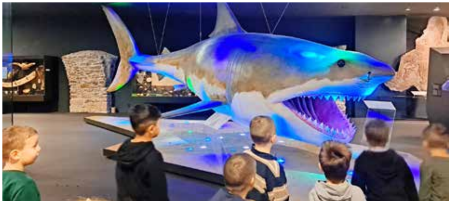
Im Schlossmuseum hatte es besonders der riesengroße Hai den Kindergartenkindern angetan.