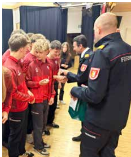
Die Betreuer und Jugendlichen der FF Winden-Windegg können stolz auf ihre erreichten Erfolge zurückblicken.

Besonders stolz kann der Nachwuchs darauf sein, heuer die Staatsmeisterschaft gewonnen zu haben. Bereits in den vergangenen 50 Jahren konnten bei Wettbewerben viele Erfolge gefeiert werden. Ein weiterer Höhepunkt wartet ebenfalls 2026 mit der Teilnahme an der Weltmeisterschaft.