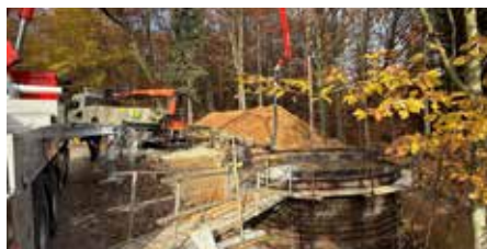
Durch die neue Anlage in Lina wird die Wasserversorgung bei Brandeinsätzen erleichtert.