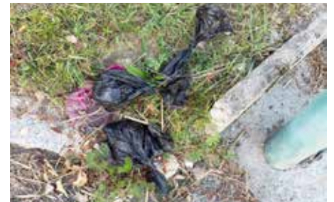
Hundesackerl entweder zu Hause in der Restmülltonne oder in den öffentlichen Mülleimern entsorgen.