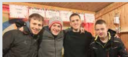
Gute Laune beim Christkindlmarkt am Stand der LJ.

Soziales Engagement wird gelebt in Schwertberg