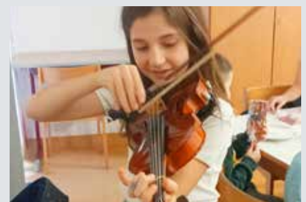
Kinder stärken ihr Selbstbewusstsein mit musikalischen Vorträgen vor Freund:innen.

Jene Kinder, die bereits ein Instrument erlernen, haben die Möglichkeit, der Gruppe ihr Musikinstrument vorzustellen und darauf zu spielen, wodurch neben dem Wissenszuwachs über das Instrument, der Selbstwert des vortragenden Kindes gestärkt wird, rhetorische Fähigkeiten verbessert werden und nebenbei die Möglichkeit besteht, diese Kinder wieder aus einer anderen Perspektive kennenzulernen. Und nicht zuletzt wird auch ein Zugang zu einem neuen Instrument gelegt, den man vielleicht sonst nicht gehabt hätte.