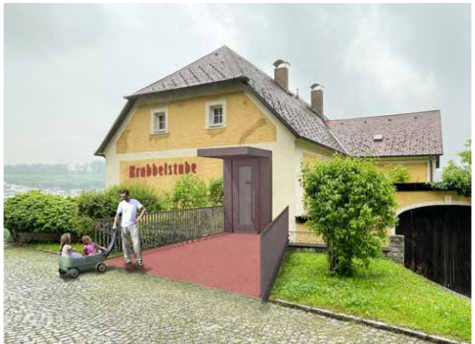
Der alte Pfarrhof wird innen völlig umgebaut und saniert, das historische Gebäude bleibt außen unverändert, bis auf den barrierefreien Zugang (siehe Bild).

Pfarrhofes ist noch rechtzeitig eingetroffen – damit steht der Weg frei für die Erweiterung der Krabbelstube, eines der wichtigsten Vorhaben der kommenden Jahre für die Bürger:innen in Schwertberg.