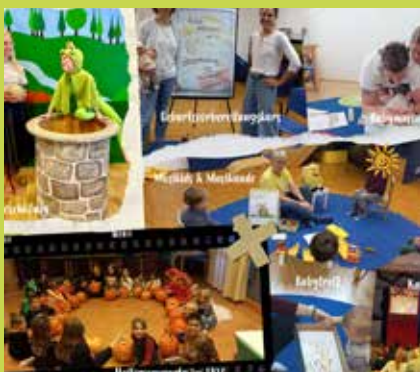
Das Frühjahrsprogramm 2026 mit allen Infos und auch die Anmeldung gibt es online unter: kinderfreunde.cc/ekiz-sonnenschein

Ein besonderes Herzensanliegen sind uns außerdem die kostenlose Familienberatung und unsere Elternbildungen – sie zählen zu den Herzstücken des EKiZ. Darüber hinaus bieten wir ein buntes Kursangebot: von Achtsamkeit und Selbstverteidigung über Musik- und Tanzkurse bis hin zu kreativen Angeboten wie Töpfern.