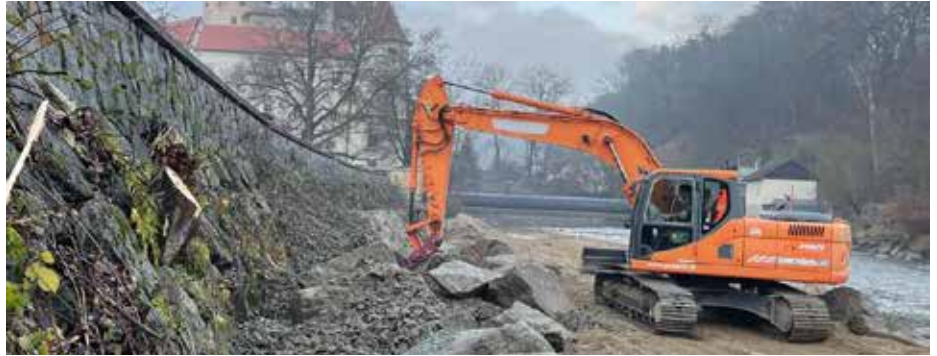
Die Schlossmauer wurde vom Hochwasser unterspült, drohte einzustürzen und wird daher verstärkt.

Mit Stand Jänner wurden auf Schwertbergs Straßen über 100 Tonnen Split und ca. 40 Tonnen Salz gestreut. Im Vergleich zu anderen Wintern wurde bisher weniger Salz verwendet, eine erfreuliche Entwicklung für die Umwelt. Das Team des Bauhofs und des Maschinenrings sorgen für eine sichere Fahrt auf Schwertbergs Straßen.